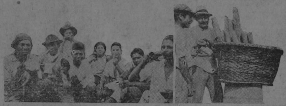
Los que no tienen compañera, se reúnen y en medio de una santa alegría abren los almuerzos y forman un "revolving"...

recorren las toscas herramientas. Cuando el sol va alcanzando su cenit, esas legiones de hombres fuertes buscan, por unos pocos momentos tan sólo, la amiga sombra bienhechora de algún árbol para hacer, cabe él, un alto a las duras faenas y dedicarse al yantar jamás tan sabroso como en esta ocasión en que aun tiemblo el cuerpo todo entero, acicateado por el trabajo incesante y rudo. Los que disfrutan de mejor bienestar económico, suelen detener al lechero que se acerca en brioso y mañoso corcel, y le compran una "medida" de leche que de mayor fuerza y contrabastamento al cuerpo cansado. Entre estas cuadrillas, hace constante acto de presencia un chico afanoso en cumplir al pie de la letra una obra de misericordia que ordena dar